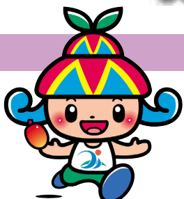
宮古島市イメージキャラクター 「みーや」