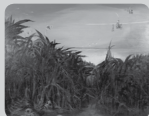
「さとうきび畑の歌」-沖縄の悲しみ- 作: 岡田徹氏