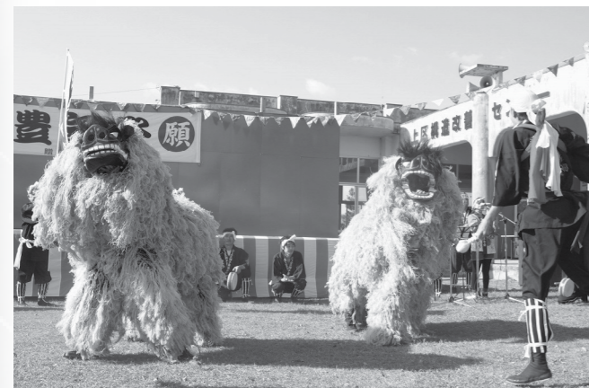
旧十五夜豊年祭での奉納獅子舞

すので大変うれしく思っています。』 「宮古島市がどんなまちになったらよいですか？」 『旧町村部の地域が活力のあるまちになってほしい。城辺地域に関しては市町村合併後、イベント等が少なくなり人と人の交流が減り、活気が無くなっているように感じる。そんななか私共の上区獅子舞保存会は島内各地で行われるイベント等に積極的に参加したり、上区地域の美化活動を行うことにより、魅力的な地域づくり活動を心がけています。各地域が各々の地域の魅力で島全体が元気の溢れる、そんなまちづくりを宮古島市には期待します。』